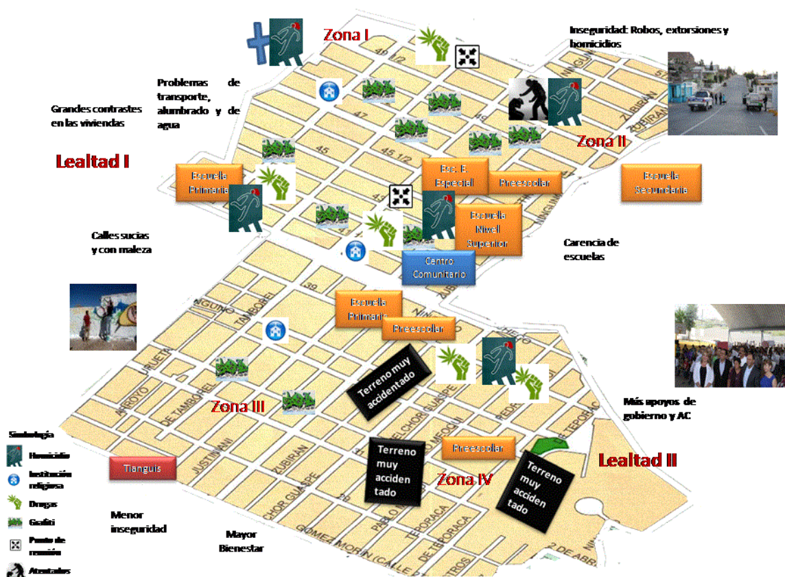
Ilustración 1. Croquis situado del contexto de estudio

En la ilustración 1 se puede apreciar la ubicación de la escuela secundaria en la zona II del croquis, la cual se distingue por contar con fuertes problemas de inseguridad, destacando principalmente los homicidios, los asaltos y robos a mano armada, por la venta y consumo de droga y las extorsiones a los residentes del lugar. Por otra parte